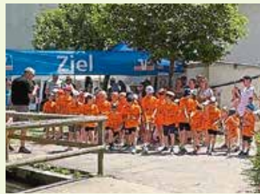
Marktlauf mit Entenrennen und Kinderkonzert