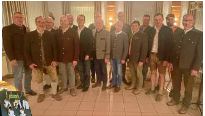
Im Rahmen der Hegeschau wurde auch die Vorstand des Jägervereins Schambachtal gewählt.

Stundenlang hatte Jägervereinschef mit seinen Vorstandsmitgliedern über zweihundert Trophäen begutachtet, ausgeschrieben, aufgehängt und so wieder eine wunderbare Hegeschau möglich gemacht. Staunend begutachteten die rund hundert erschienenen Waidmänner die Rehbock-Geweih, tauschten sich aus und klopfen auf Schultern und gratulierten zu Volltreffern. Der Hegering Pondorf mit 7.700 Hektar besteht aus den Gemarkungen Bettbrunn, Breitenhill, Megmannsdorf, Mendorf, Pondorf, Sandersdorf, Schafshill, Schamahaupten, Steinsdorf, Thannhausen, Winden und Wolfbuch. Der Hegering Altmannstein mit 6.100 Hektar bildet sich aus den Gemarkungen Altmannstein, Berghausen, Hagenhill, Hexenagger, Hüttenhausen, Laimerstadt, Lobing, Schwabstetten und Tettenwang. Interessant wurde es, als Robert Kraus die Abschusszahlen 2025 in den beiden Hegeringen bekanntgab. So tätigten die Jäger im Hegering Altmannstein von dem im ersten Jahr des dreijährigen Abschussplanes bei genehmigten 102 Rehbock-Abschüssen sogar 107 Abschüsse. Nur sechs Prozent davon waren Fallwild oder fielen dem Straßenverkehr zum Opfer. Vierzig Prozent des Wildes erlegten die Revierinhaber, den Großteil die