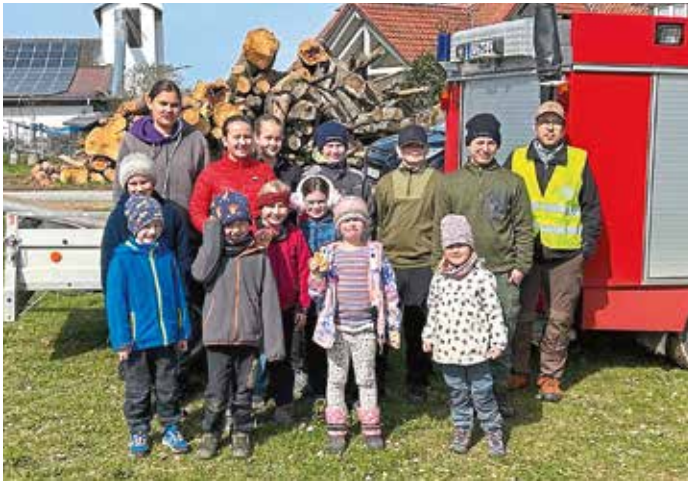
In zwei Gruppen eingeteilt sammelten Kinder und Erwachsene weggeworfenen Unrat ein.