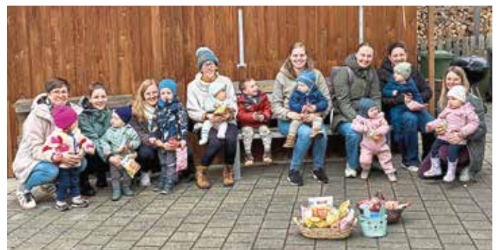
Zu einer fröhlichen Osterfeier trafen sich Mamas und Kinder der Muki-Gruppe Schamhaupten.