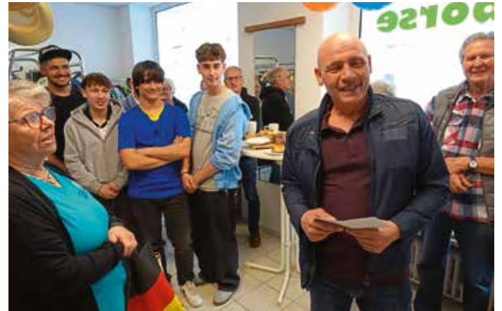
Ausgelassene Stimmung zwischen Mitarbeiterinnen und Besuchern