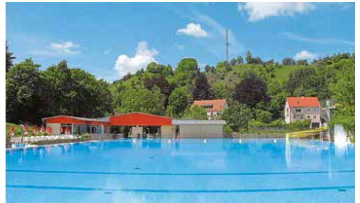
Das Altmannsteiner Freibad lockt mit seiner tollen Lage und dem alten Baumbestand, der im Sommer herrlichen Schatten spendet.