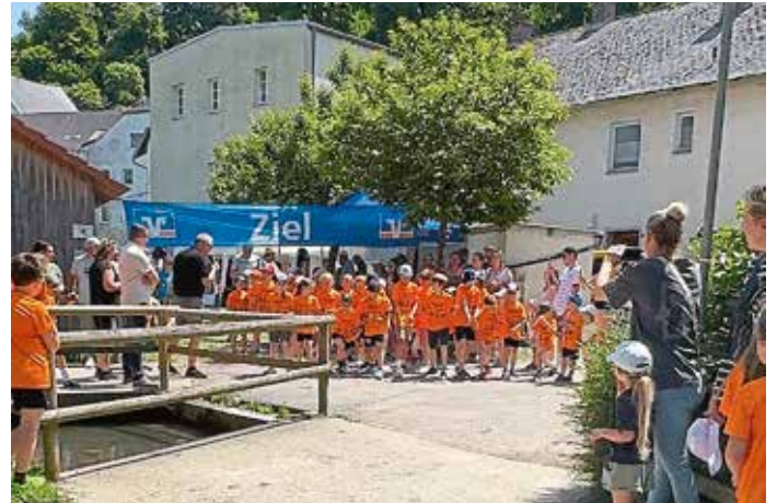
Startschuss für den beliebten Marktlauf ist um 13 Uhr.

Besonders wichtig ist den Organisatoren dabei nicht nur der sportliche Gedanke, sondern vor allem die Freude an Bewegung, Gemeinschaft und einem unvergesslichen Erlebnis für die Kinder. Deshalb erhält jedes teilnehmende Kind vor dem Lauf ein kostenloses T-Shirt und nach dem Zieleinlauf selbstverständlich eine Medaille als Erinnerung an den großen Tag.