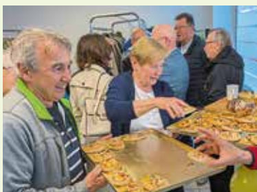
10 Jahre Kleiderbörse