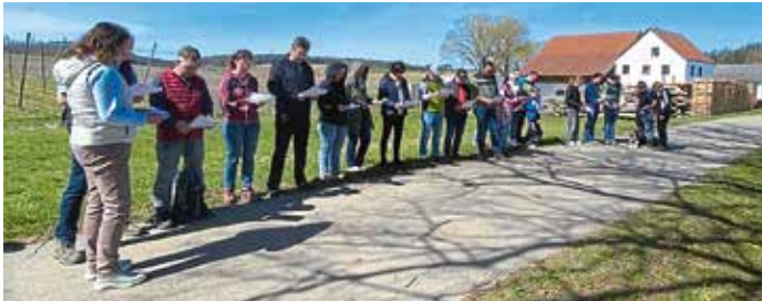
Sichtlich erfreut zeigten sich über drei Dutzende Pfarrangehörige beim Emmausgang bei der ersten Station beim Holzkreuz.