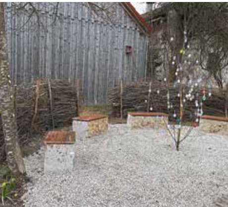
Zwei Totholzhecken schützen und verschönern die Sitzgelegenheiten – zugleich auch Rückzugsgebiet für Insekten.

ler eine Totholzhecke an. Das Material aus Haselnusspflocken nahmen die Helfer kurzerhand vom Häckselhaufen, welchen die Dorfbewohner angefahren haben. So schließt sich auch hier ein wichtiger Recycling-Kreislauf. Erst kürzlich haben die OGV-Gartenwichter in ihrer Frühjahrsaktion auf dem öffentlichen Platz einen Birkenbaum aufgestellt und mit bunt gestalteten Ostereiern geschmückt. Zur Abrundung der nachahmenswerten Gemeinschaftsaktion und zur Abrundung des Dorfbildes reinigten die OGV'ler die Glasscheiben von Plakatresten und Schmutz. „Wir danken allen freiwilligen Helfern für das tolle Engagement und Arbeitsfreude zum Allgemeinwohl“, so Eberl.