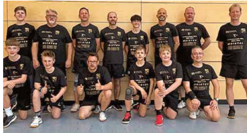
Alle Spieler der Meistermannschaften

derinsteigern eine Möglichkeit am sportlichen Wettbewerb teilzunehmen. Bei den Spielern war vor allem in der Rückrunde eine deutliche Leistungssteigerung zu erkennen. Auch hier sieht man was regelmäßiges Training ausmachen kann.“