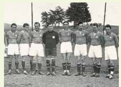
95 Jahre FC Sandersdorf