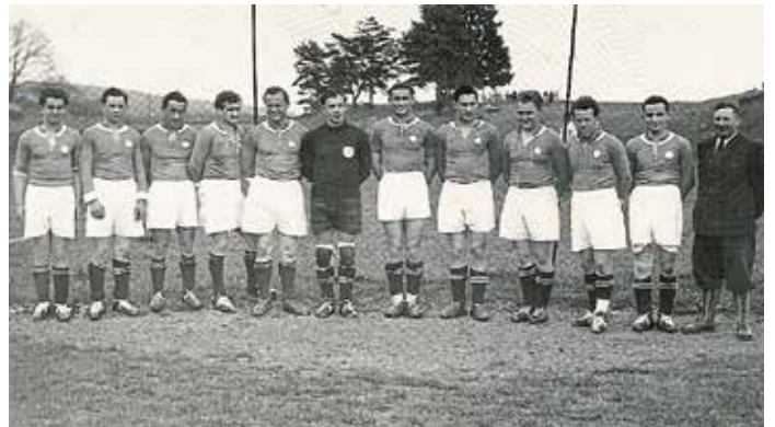
Die erste Mannschaft aus dem Jahr 1931 legte den Grundstein für den Verein.