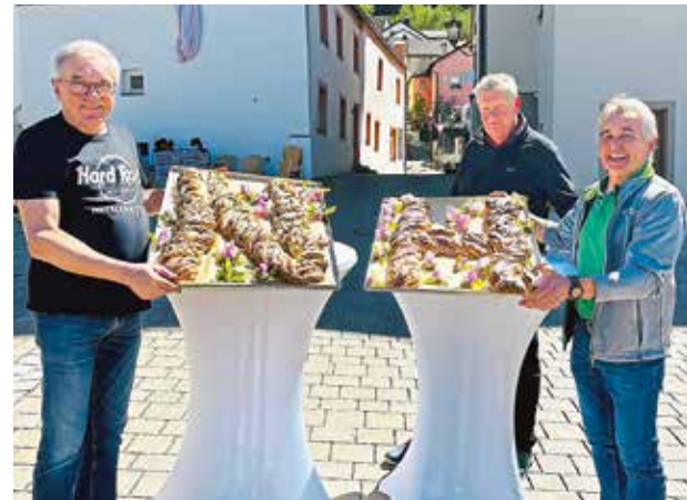
Nusszopf vom OGV Altmannstein