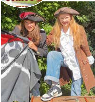
Die DONIKKL Crew sorgt für Stimmung.

Doch der Marktlauf bietet auch abseits der Laufstrecken ein abwechslungsreiches Rahmenprogramm für die ganze Familie. Ein besonderes Highlight wartet bereits um 14:00 Uhr auf die Besucher: Die DONIKKL-Crew sorgt mit ihrer Kinder-Mitmach-Konzert-Party für Stimmung, Musik und jede Menge Bewegung. Mitsingen, mittanzen und mitfeiern ist ausdrücklich erwünscht. Das Konzert verspricht beste Unterhaltung für Kinder und Eltern gleichermaßen und dürfte für viele Familien ein ganz besonderer Höhepunkt des Tages werden.