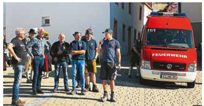
Abholung der FFW Altmannstein zur Aufstellung des Maibaums