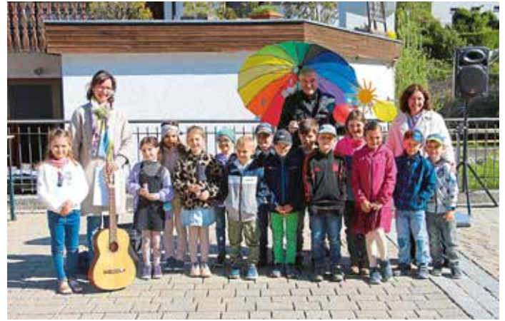
Verabschiedung Grundschule Pondorf