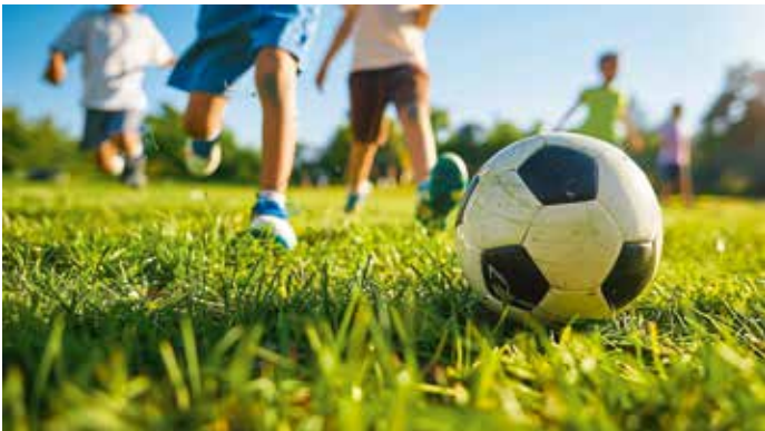
Familien und vor allem Kinder sind eingeladen, ihr Geschick am Ball zu beweisen.

Das Festwochenende startet am Freitagabend, 17. Juli, ab 21:00 Uhr mit den „Felsenbeats“. Bei dieser Party sorgt DJ Novem im Felsenstadion für den passenden Sound, um die Jubiläumstage schwungvoll einzuläuten. Der Einlass zu dieser Veranstaltung ist ab 16 Jahren gestattet.