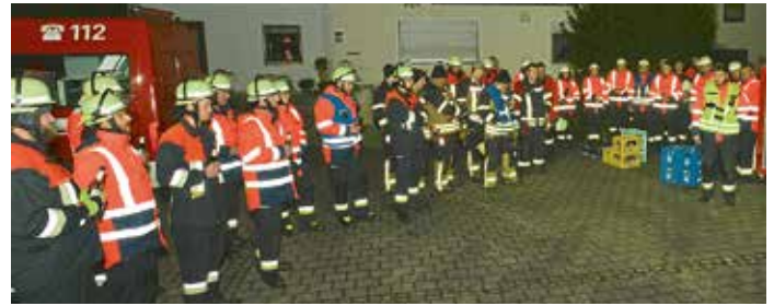
Die Großübung mit sieben Feuerwehren, die 2025 in Laimerstadt stattfand und der Höhepunkt des Jahres war.

Zur Ausbildung wurden 2025 zwölf Feuerwehrübungen abgehalten. Diese waren immer gut besucht. Zusammen mit den Feuerwehren aus Hagenhill und Tettenwang machte man in Hagenhill eine Gemeinschaftsübung. Thema war die Bekämpfung eines Waldbrandes mit anschließender Vermisstensuche und Erstversorgung. Im Herbst kam spontan noch eine Übung mit der Tettenwanger Wehr hinzu. Auch hier mussten wieder vermisste Personen gesucht werden. Da diese Übung bei Dunkelheit stattfand, stellte man an der Ausrüstung fest, dass die Beleuchtungsausrüstung ausgetauscht werden sollte. Highlight des Jahres war die Großübung mit den sieben Feuerwehren und etwa 75 Teilnehmern aus den Feuerwehren Laimerstadt/Ried, Altmannstein, Tettenwang, Hagenhill, Riedenburg, Lobsing und Irn-