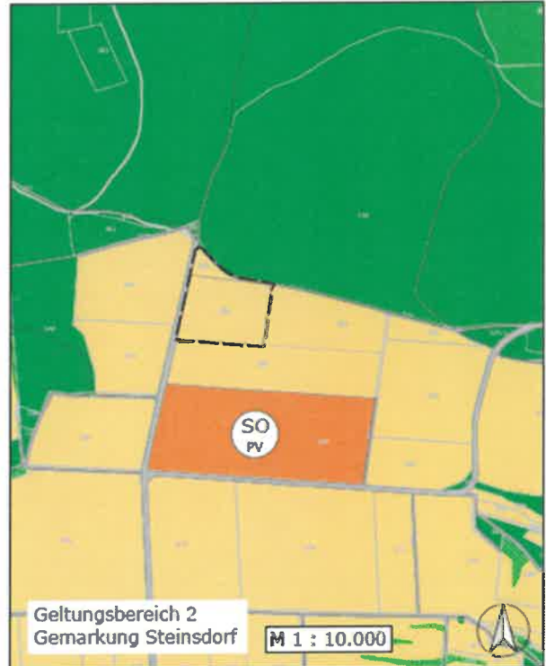
Stand vor der Änderung des Flächennutzungsplans