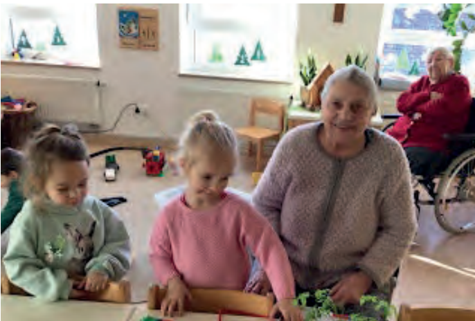
Fotos aus dem Alltag der Krippenkinder, die sich gerade kreativ beschäftigen und Altenheimbewohner besuchen und mit unseren Kindergartenkindern Spiele machen.