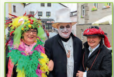
Gute Laune trotz Nieselregen