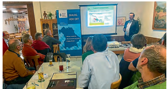
Knapp hundert interessierte Besucher aus dem Umkreis von Altmannstein, darunter auch einige Frauen, nutzten am Montagabend den Informationsaustausch zum Thema „Mein Haus – Mein Kraftwerk“ im Landgasthof Sebastian Forster in Tettenwang.

liche Einspeisevergütung von anfänglich 50,90 Cent/kWh auf heute 8,1 Cent/kWh gefallen ist, haben sich seit 2006 auch die Anschaffungskosten für Photovoltaikanlagen von 5000 Euro auf 1250 Euro je kWp um etwa 75 Prozent reduziert. Daraus ergibt sich, dass die Herstellung einer Kilowattstunde Solarstrom – je nach Anlagengröße – nur noch zwischen 6 und 10 Cent beträgt“, so Haslinger.