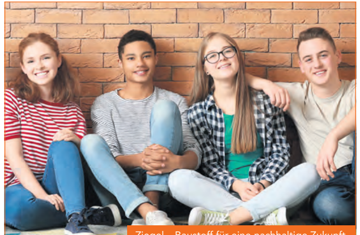
Ziegel – Baustoff für eine nachhaltige Zukunft

SCHLAGBAUER malerbetrieb & werbetechnik Felsenblick 8 · 93339 Riedenburg Tel. 0 94 42/9 21 67 08 · E-Mail: mail@schlagbauer.de