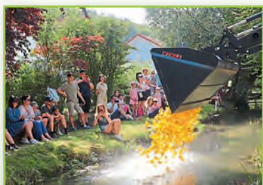
Gmiatlich is im Hofergarten