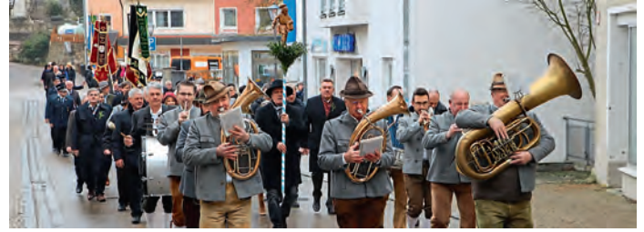
Die Hagenhiller Blaskapelle begleitete den Kirchenzug am Bauernjahrtag in Altmannstein.

Den 272. Bauernjahrtag feierte der Bauern- und Arbeiterverein Altmannstein und Umgebung in den aktuell unruhigen Zeiten für die Landwirtschaft. Die Festredner gingen dabei auch auf diese besondere Situation des Bauernstandes ein. Zunächst aber traf man sich zum Weißwurstfrühstück im Vereinslokal Neumayer. Die Hagenhiller Blaskapelle spielte ein Standkonzert und traditionell wurden auch die Buchsbaumsträußchen wieder ans Revers der Jahrtagsbesucher geheftet. Der leichte Nieselregen hielt wohl den einen oder anderen Interessenten von einem Besuch ab, denn der Kirchenzug war in den vergangenen Jahren schon mal etwas länger. Mit Blasmusik zog man zur Heilig-Kreuz-Kirche in der der Festgottesdienst zelebriert wurde. Pfarrvikar Thomas Arokiasamy begrüßte die Gottesdienstbesucher und sagte: „Es ist wirklich lobenswert, dass sie an ihre verstorbenen Mitglieder denken“. Die Jahrtagsmesse dient in jedem Jahr dazu, der gestorbenen Mitglieder zu gedenken. Auch heuer las man die zwölf im vergangenen Jahr gestorbenen Vereinsmitglieder vor. In der Predigt erinnerte der Pfarrvikar daran, dass Gott uns die Erde überlassen hat, sie zu bearbeiten und zu bewahren. „Die Bauern versorgen die Bevölkerung mit einer Vielfalt an Lebensmitteln. Dafür dass alle das tägliche