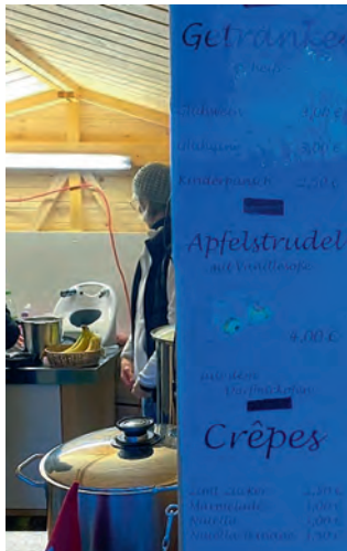
Reissenden Absatz fanden die Crêpes und der im Dorfbackofen zubereitete Apfelstrudel.

Tettenwang – Den Kontakt im Hopfendorf zu fördern und das Miteinander zu pflegen – das sind die zwei wichtigsten Hintergründe des mittlerweile zum 4. Mal organisierten „Stodlzauber“. Die örtlichen Vereine Tettenwangs mit Feuerwehr, Frauenbund, Landjugend und Obst- und Gartenbauverein hatten den Hof des Dorfgemeinschaftshauses in der Schulstraße 10 in der Ortsmitte mit Fichtenbäumchen und den vereinseigenen Holzblockhütten festlich geschmückt. Bei Einbruch der Dunkelheit fanden sich bereits die ersten Gäste ein, die sich bis