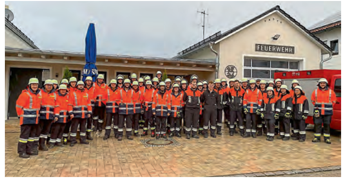
Gemeinschaftsübungen mit der FFW Tettenwang und Hagenhill.

prüften die Kasse und stellten eine hervorragende Kassenführung fest. Auf deren Antrag wurde der Schatzmeister und die Vorstandschaft von den 30 anwesenden Mitgliedern einstimmig entlastet.