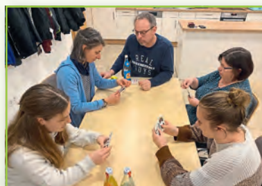
Sehr beliebt: Schafkopfkurs