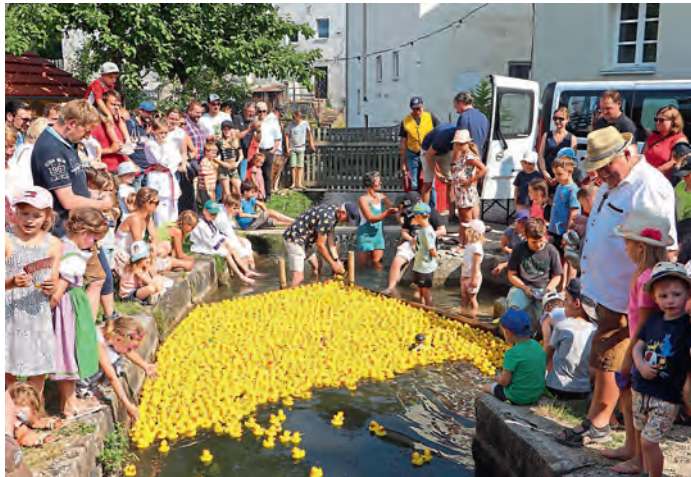
Knapp 2500 Enten machten sich auf den Weg ins Ziel. Mit Spannung wurde bereits der Start erwartet, der sich etwas verzögerte.

Weiter geht's um 17 Uhr mit dem 11. Altmannsteiner Entencup des Lions-Club Beilngries . Die 10 Hauptpreise werden feierlich ab 18 Uhr an die Besitzer der schnellsten Enten überreicht.