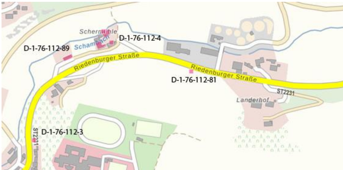
Abb. 7. Ausschnitt Denkmaltatlas Bayern (Bayerisches Landesamt für Denkmalpflege)

Gemäß dem Bayerischen Denkmaltatlas des Bayerischen Landesamtes für Denkmalpflege (2019) sind im Geltungsbereich und dessen Umfeld folgende Bau- und Bodendenkmale oder sonstige Kulturdenkmale vorhanden.