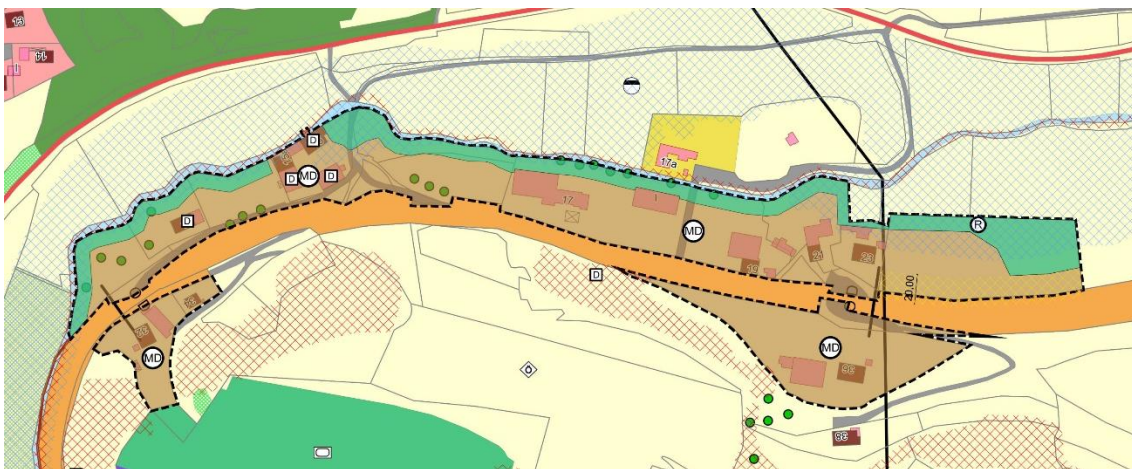
Abb. 1. Gültiger Flächennutzungsplan (Januar 2018)

Der aktuelle Flächennutzungsplan von Januar 2018 sieht für den betroffenen Geltungsbereich Dorfgebiet gem. § 5 BauNVO vor. Entlang der Schambach ist ein breiter Pufferstreifen vorgesehen, der als Retentionsraum dient.