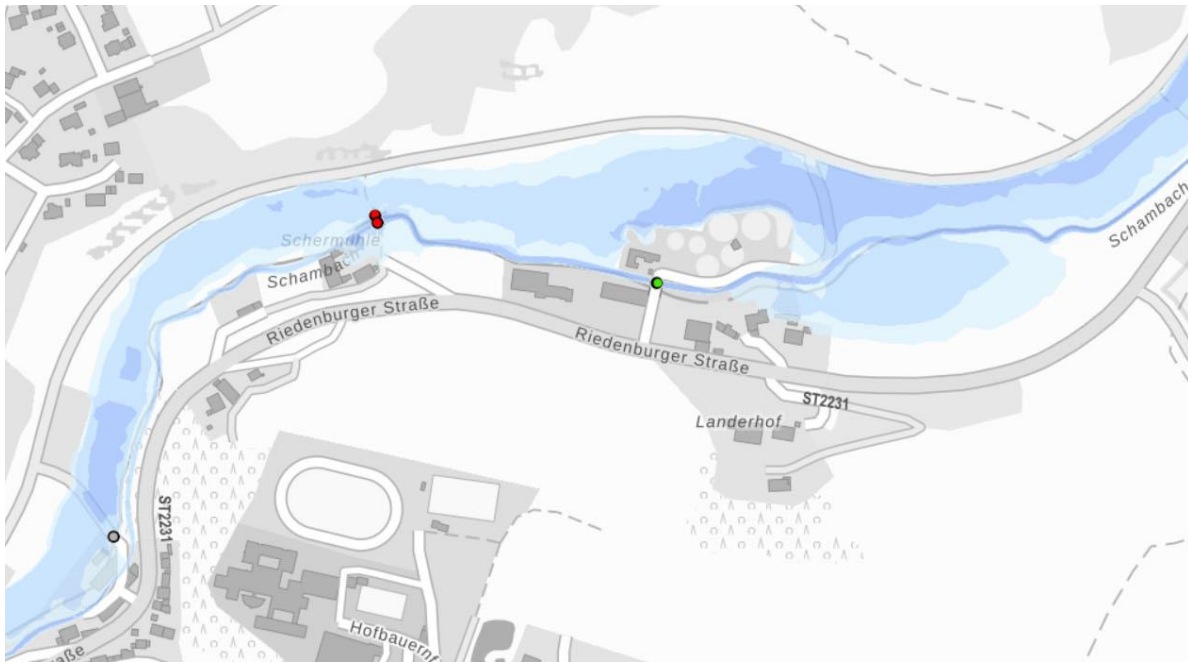
Abb. 6. Hochwassergefährdungsflächen HQ 100 laut „Überschwemmungsgefährdete Gebiete in Bayern“ (Stand März 2019)

Der Bereich nördlich der Riedenburger Straße liegt fast vollständig im wassersensiblen Bereich.