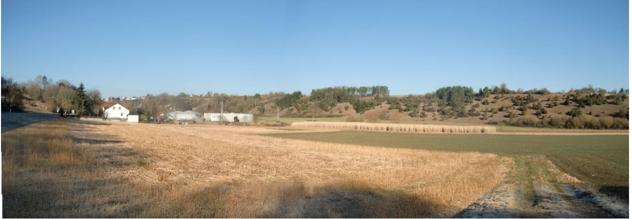
Abb. 3. Landwirtschaftlich genutzter Bereich im Osten / Blick auf bestehende Kläranlage (Februar 2019)