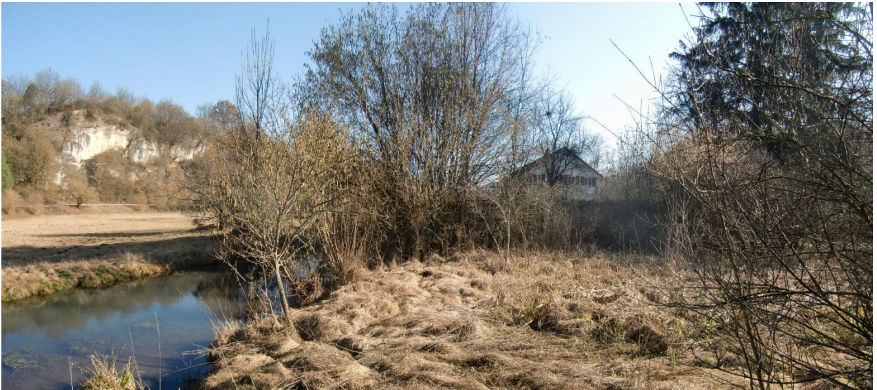
Abb. 5. Verwildertes Bachgrundstück im Westen (Februar 2019)

Der Geltungsbereich liegt im Naturpark Altmühltal (NP-00016) und kleinere kartierte Biotope sind randlich betroffen.