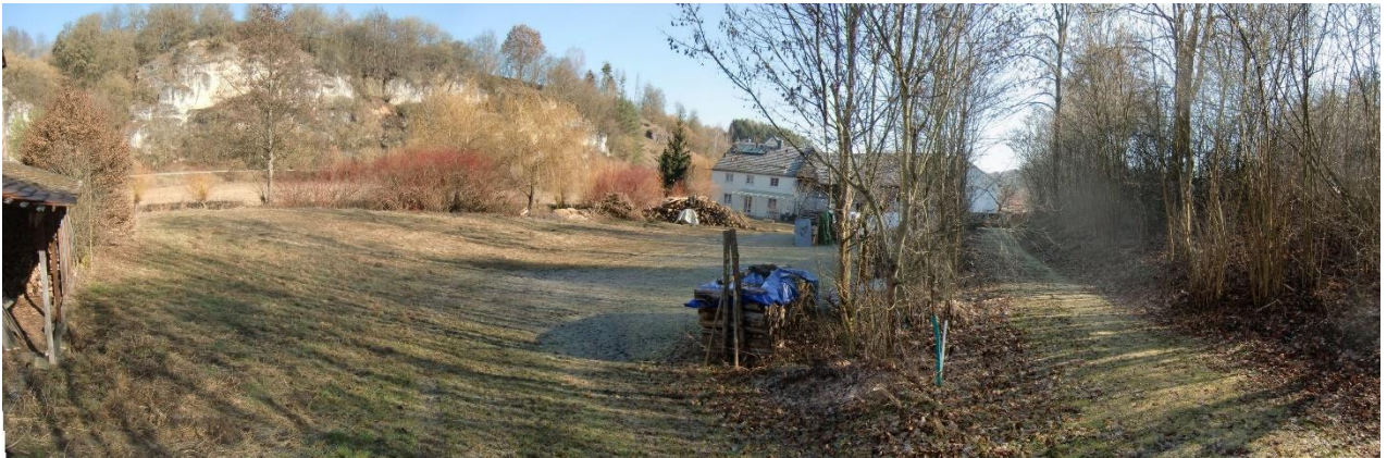
Abb. 4. Fläche für ein Einfamilienhaus westlich Schermühle (Februar 2019)